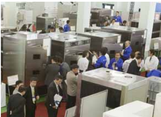
早朝からにぎわう会場（耐候コーナー）