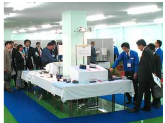
Mobile 製品に注目が集まる（測色コーナー）