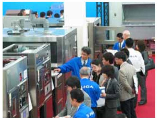
熱心なご見学に、説明員にも力が入る（腐食コーナー）