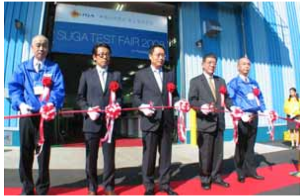
テープカット 2008年10月2日