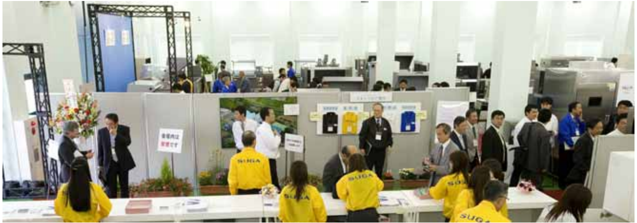
最寄り駅からの送迎バス到着、お迎えする受付スタッフ