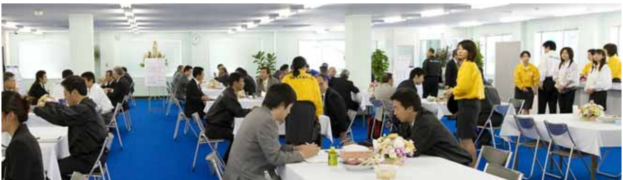
工場見学、セミナー聴講後、休憩室で活発な意見交換。