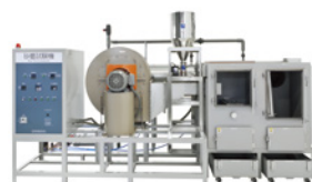
横風高風速用 (中型)

試料が回転し複数個の試料に均一の試験が可能。試料通電装置により試料を使用状態で試験が可能。