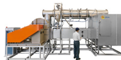
横風高風速用 (大型)

試料角度を変えることにより、試料の使用状況を再現。ダスト回収箱はキャスター付で移動容易。