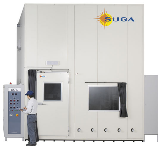
IEC 降塵試験用の大型塵埃試験機