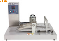
FR- I BS 型

FR- I A 型：手動式 / FR- I B 型：自動式 / FR- I BS 型：自動 3 連式