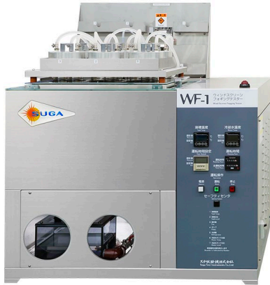
フォギングテスター WF-1 (オイル加熱方式)