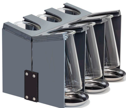
図1 試験瓶の保持台

オイル加熱方式のフォギングテスター WF-1の試験瓶は、外部にオイルが付着してしまい、試験の都度オイルを取り除く必要があります。この保持台は、試験瓶を斜めに保持することで、付着したオイルを効率よく除去できる設計になっています。試験後の清掃作業の手間を大幅に軽減し、作業効率が向上します。