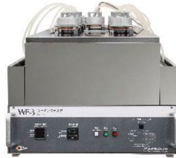
フォギングテスター WF-3 (空気加熱方式)